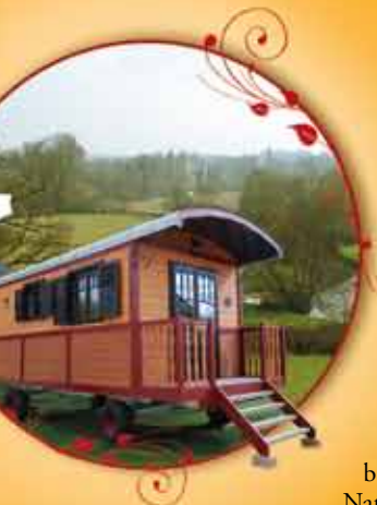
Plan d'une roulotte