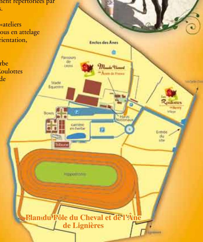
Plan du Pôle du Cheval et de l'Âne de Lignières